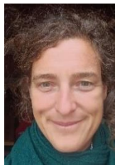
Isabelle de CAUNES